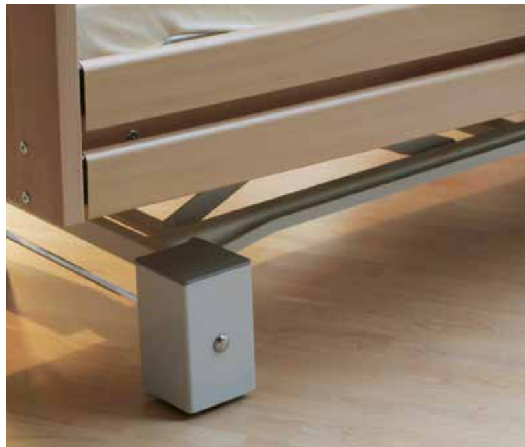
Elegant verkleidete Laufrollen

Alle allegra - Modelle sind wahlweise mit durchgehenden oder geteilten Seitengittern erhältlich. Die durchgehenden Seitenteile werden in einer in den Massivholzrahmen integrierten Schiene geführt.