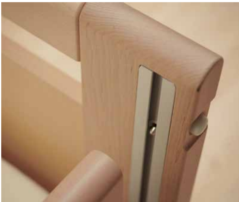
Führungsschiene für Seitengitter

Neben den Vorzügen aller allegra - Modelle ist die Besonderheit dieses Bettes vor allem im optischen Bereich zu sehen. Die elegant verkleideten Rollen geben dem Bett ein wohnliches Aussehen. Das organisch im Bettdesign integrierte Fahrgestell und Hebesystem ist voll unterfahrbar und bedeutet somit eine große Erleichterung für die pflegenden Personen.