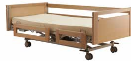
Beide Seitengitter weggeklappt