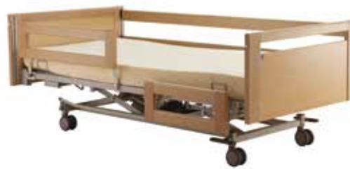
Seitengitter einzeln verstellbar