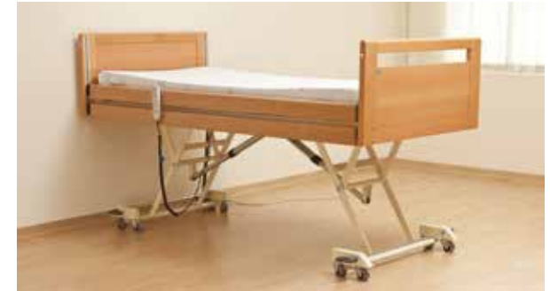
Niedrigbett höchste Einstellung