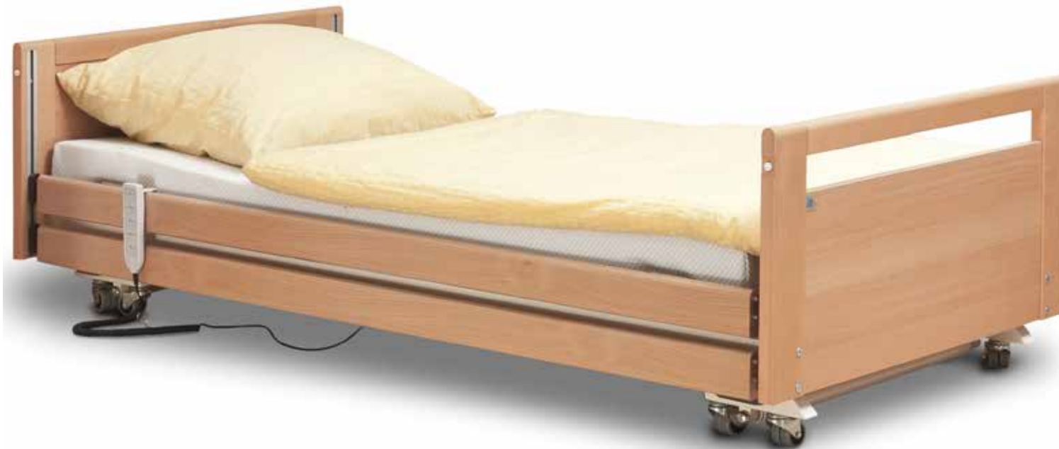
allegra Niedrigbett in tiefster Einstellung zur Sturzprophylaxe

Die allegra - Niedrigbett - Variante vereint als Besonderheit eine extreme Tieflage von 20 cm und eine für das Pflegepersonal oder den Partner rückschonende Arbeitshöhe von 80 cm. Gerade auch die maximale Tiefstellung von 20 cm bedeutet für viele Problemstellungen eine perfekte Lösung. Ein Herausfallen stellt für den Patienten aus dieser Höhe keine Gefahr dar. Vor allem der aufgrund dieser Option mögliche Verzicht auf Seitengitter hat für die Patienten gerade im emotionalen Bereich eine extreme Bedeutung. In der Gesamtheit erfüllt es alle an moderne Pflegebetten gestellte Anforderungen.